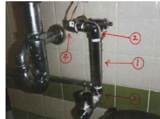
③ 止水栓等取付調整