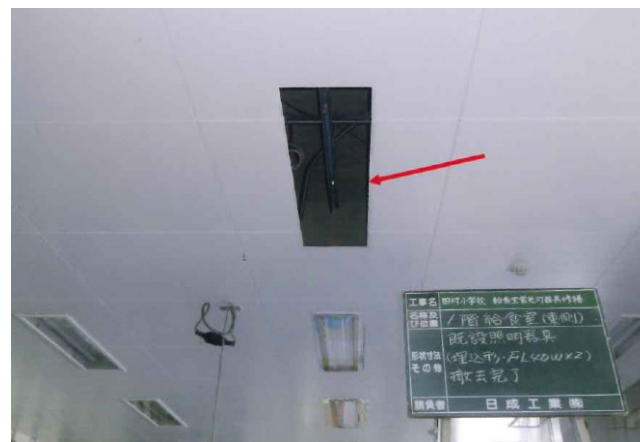
② 既設照明器具撤去