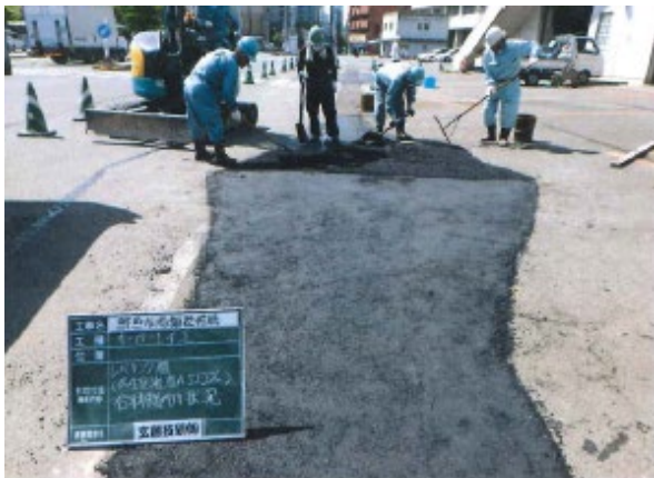
③ アスファルト舗装