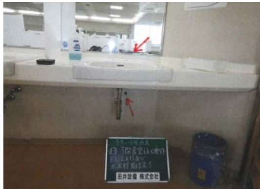
② 既設水栓・止水栓撤去